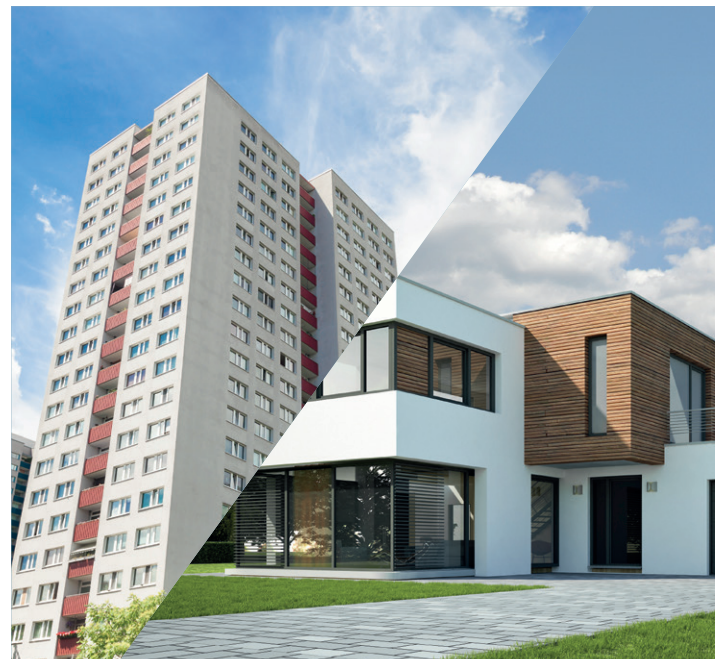
Tiberius Gracchus