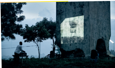
Togoland Projektionen - Drop-out Cinema ©

Der Hamburger Filmregisseur Hans Schomburgk reiste 1913 mit seiner Partnerin Meg Gehrts durch die deutsche Kolonie Togo und filmte dort Szenen, die Sklavenarbeit und die Überheblichkeit der Kolonialmacht zeigten. Diese Bilder werden nun von Jürgen Ellinghaus in Togo an den Originaldrehorten gezeigt. Gehrts' verklärte Tagebucheinträge und Kolonialberichte stehen im Kontrast zu den harten Realitäten der Bilder. Die Vorführungen regen die Zuschauer*innen zum Nachdenken über Traditionen, Klischees und den „weißen Blick“ an. In ländlichen Dörfern wecken die Filme Erinnerungen an überlieferte Geschichten, während in Lomé junge Menschen diskutieren, wie man mit diesem Material umgehen soll. „Togoland Projektionen“ verdeutlicht, dass diese schmerzhaften Dokumente sowohl in Togo als auch in Deutschland gebraucht werden. Sie helfen, die Geschichte aufzuarbeiten und den heutigen sowie historischen Rassismus zu konfrontieren.