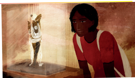
Sultanas Traum

In einer indischen Buchhandlung entdeckt Inés, eine junge Künstlerin aus San Sebastián, ein rätselhaftes Buch, das ihr Leben verändert: „Sultana’s Dream“, geschrieben 1905 von der bengalischen Autorin Rokeya. Die Erzählung entführt sie nach Ladyland, einem Paradies, in dem Frauen regieren, forschen und im Einklang mit der Natur leben, während Männer hinter Mauern für Hausarbeit und Kinderbetreuung zuständig sind. Die visionären Ideen und die Persönlichkeit der Autorin fesseln Inés, wecken ihren Drang nach Freiheit und inspirieren zu großen Träumen. Auf der Suche nach den Spuren Rokeyas und Ladylands begibt sie sich auf eine faszinierende Reise durch Indien, Bangladesch, Sodepur, Vrindavan, Rom und zurück in ihre Heimat Spanien.